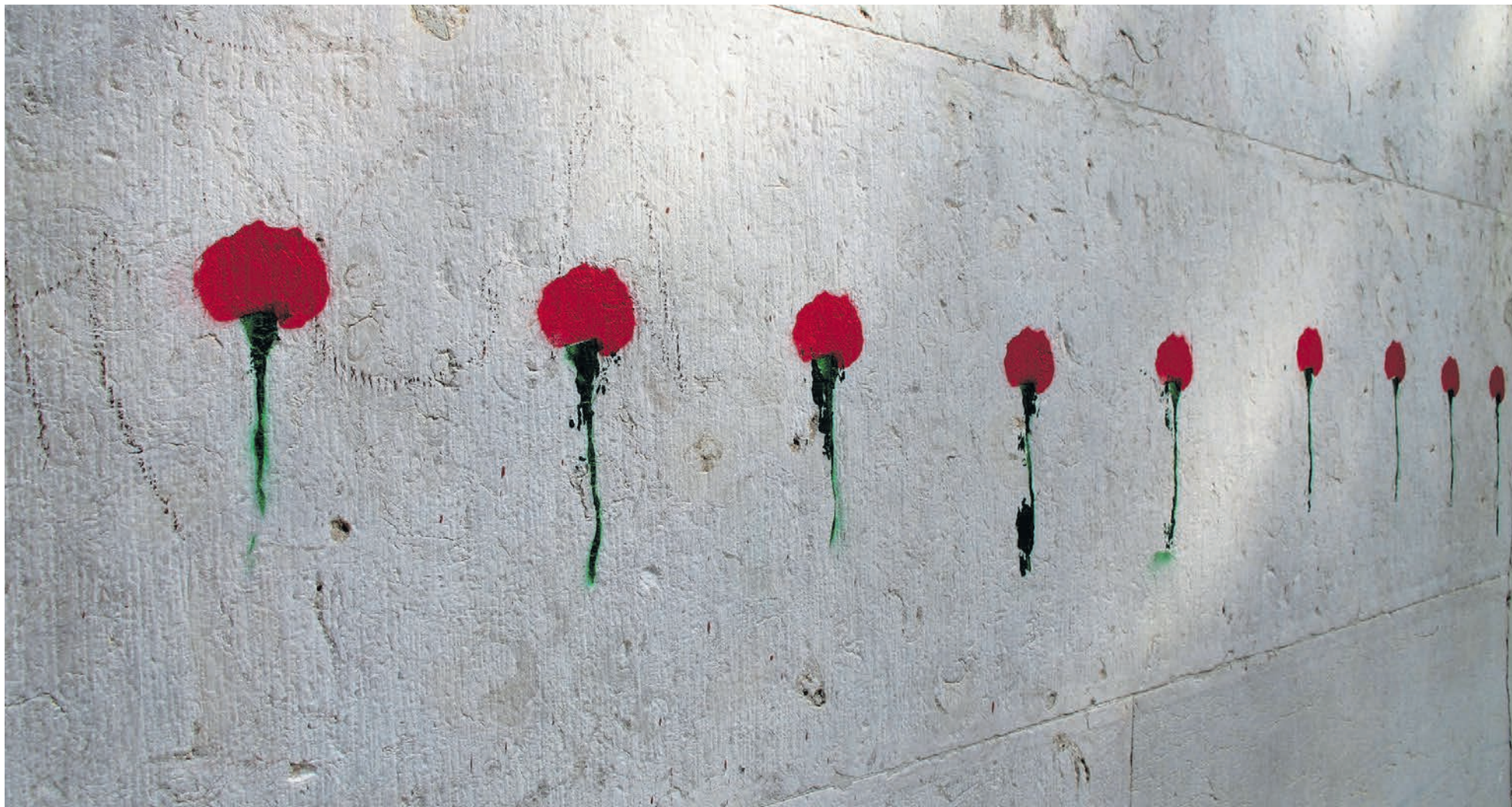
A longa noite fascista terminou a 25 de abril de 1974