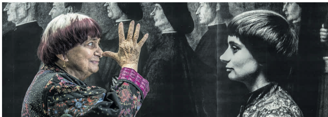
Cineasta Agnès Varda