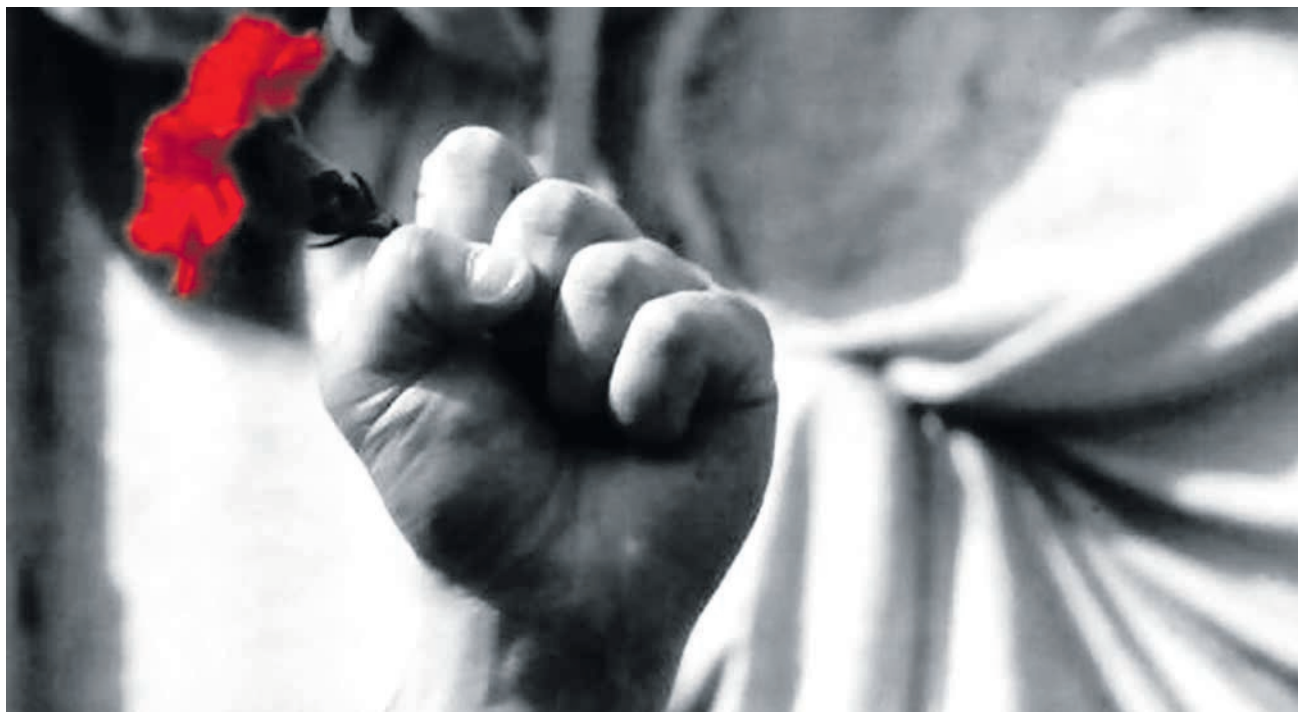
A 25 de abril e 1 de maio realizam-se os anuais desfiles de comemoração da revolução e da luta dos trabalhadores

No ano em que a revolução comemora 45 anos, as ruas de Lisboa prometem aquecer. No dia 24 de abril, o Largo da Graça vai encher-se de crianças durante a tarde com música e animação. Às 19 horas, arranca um desfile que parte de Sapadores rumo à Praça Paiva Couceiro onde, a partir das 20 horas, se concentram as celebrações noturnas do dia em que os militares e o povo puseram fim à mais longa ditadura da Europa. É no dia 25 de abril, a partir das 14h30, que a Avenida da Liberdade se volta a encher de mulheres e homens comprometidos com a revolução e os seus avanços.