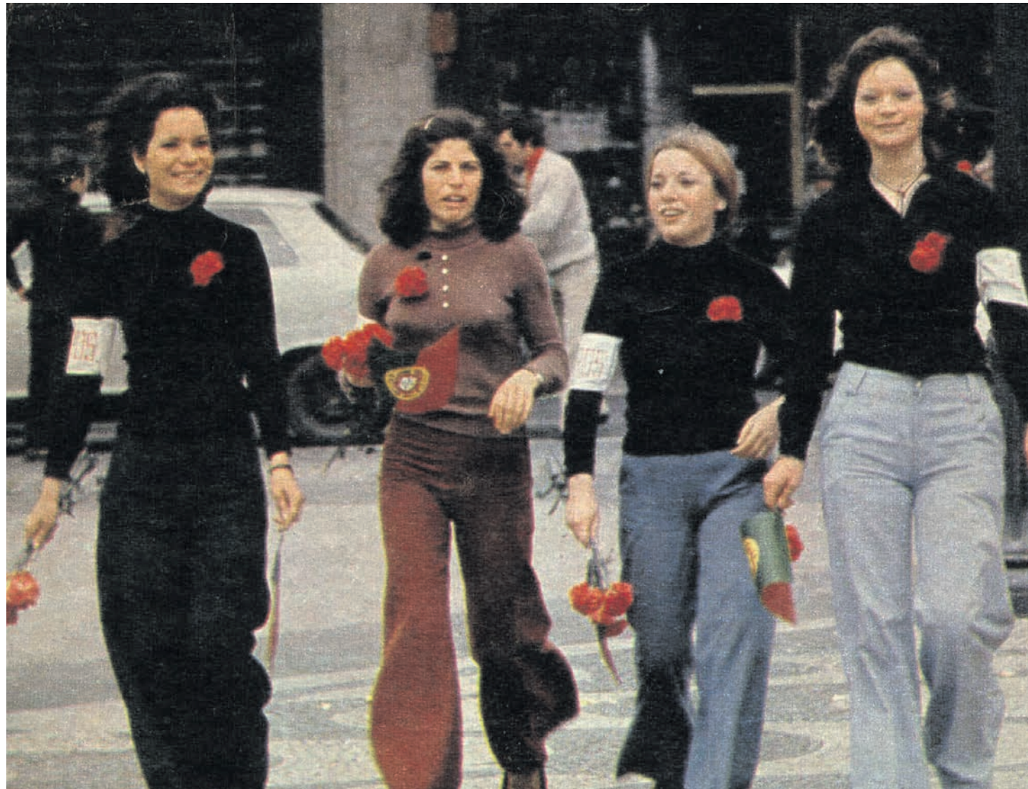
A participação das mulheres na revolução foi preponderante

Em 1974, apenas 25% dos trabalhadores eram mulheres e apenas 19% trabalhavam fora de casa. Geralmente, ganhavam menos 40% do que os homens que tinham o direito de proibir as esposas de trabalhar fora de casa. Aliás, se a mulher exercesse atividades lucrativas sem o consentimento do marido, este podia rescindir o contrato. Entre as bizarras impostas pelo fascismo às mulheres portuguesas estava o impedimento de exercerem a carreira militar, policial, diplomática e magistratura. Legalmente, professoras primárias, enfermeiras e hospedeiras de bordo tinham limitações no acesso ao casamento. O marido tinha o direito de abrir a correspondência da mulher que tampouco podia viajar para o estrangeiro sem a sua autorização e o código penal permitia ao marido matar a mulher em flagrante adultério, apenas com um desterro de seis meses.