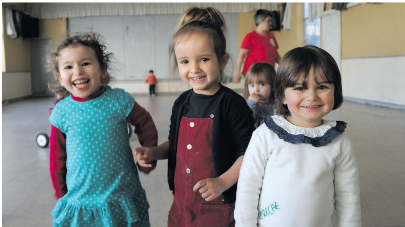
No espaço educativo da Graça a oferta educativa vai do pré-escolar ao 2.º ciclo

A primeira escola d'A Voz do Operário surgiu em 1891 na Calçada de São Vicente. Em 1938, com a instituição já instalada no atual edifício, cerca de 4200 crianças, maioritariamente filhas de operários estudavam em escolas da instituição. "Ensinar a ler é acender lume; toda a sílaba soletrada lança faíscas", enunciavam as palavras do escritor francês Victor Hugo nas páginas deste jornal em 1908. As sementes lançadas pelos trabalhadores do tabaco são um projeto ímpar que continua vivo na maior das escolas d'A Voz do Operário, na Graça.