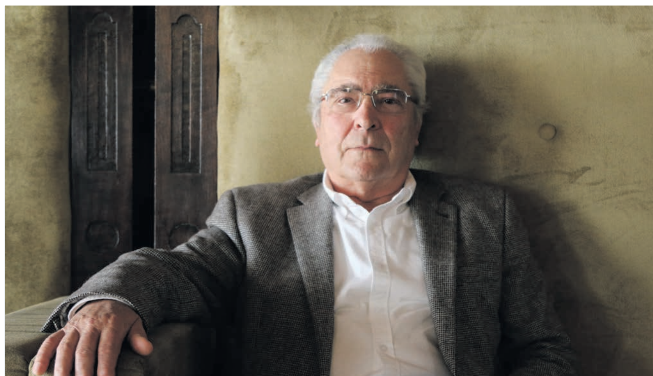
“Portugal ainda é o país de Abril”