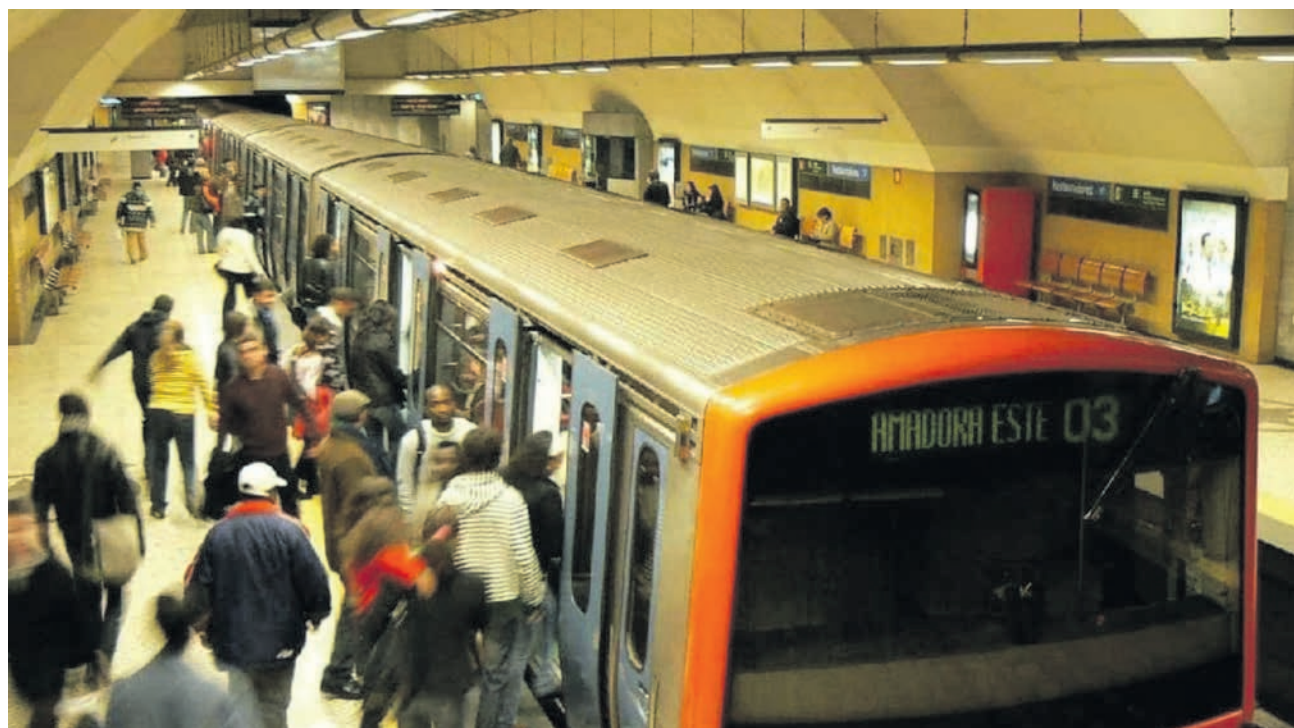
Medida substitui 700 passes inter modais e sociais distintos por apenas duas modalidades