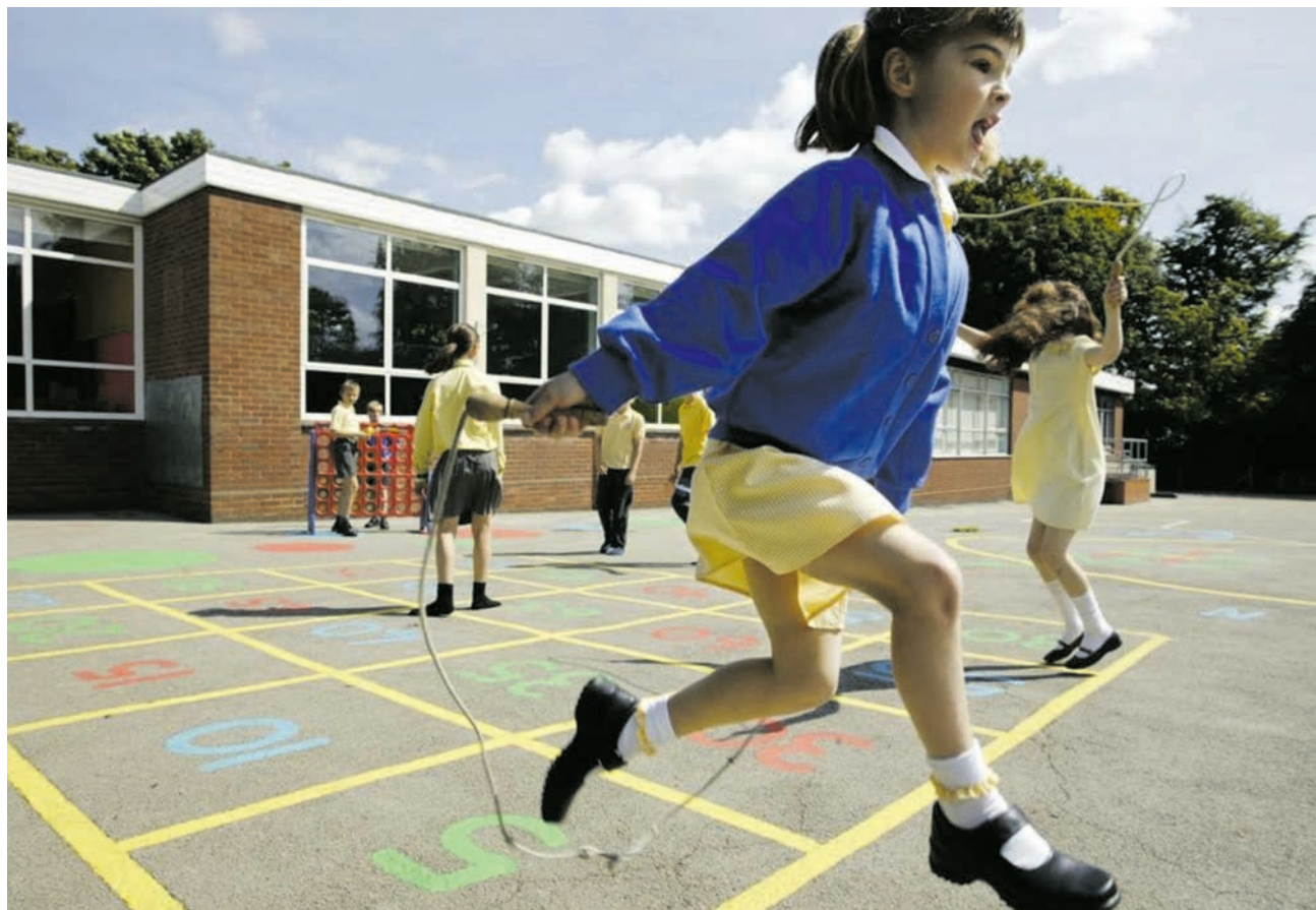
O recreio escolar é apontado como um lugar privilegiado para a aprendizagem e desenvolvimento das crianças

Culturalmente, habituámo-nos a olhar para o recreio como um momento de pausa do trabalho. É efectivamente um momento em que nós, adultos, podemos parar para recuperar parte da energia gasta no trabalho desenvolvido. Será contudo importante recordar que, para as crianças que fomos, o nosso recreio era o momento de sermos verdadeiramente felizes e de fazermos o que dava realmente gozo e prazer.